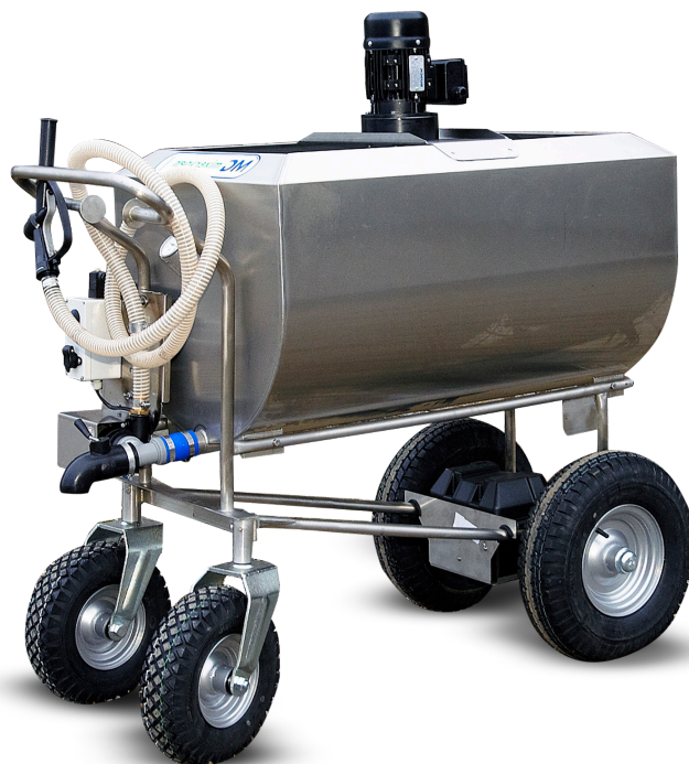
MG STANDARD MÆLKEVOGN