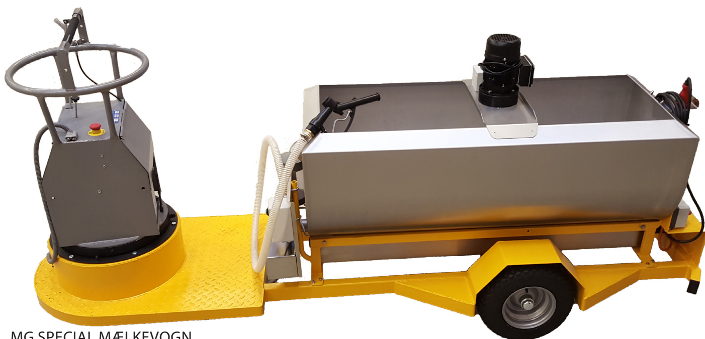
MG SPECIAL MÆLKEVOGN